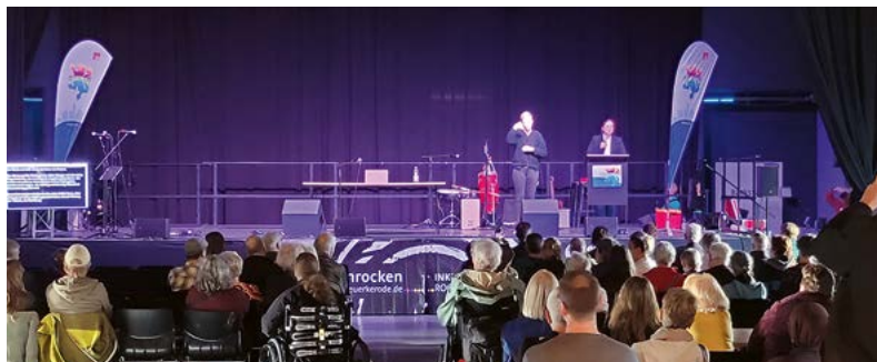
Die Bühne der Inklusionskonferenz im Braunschweiger Westand und Kufa Westbahnhof.