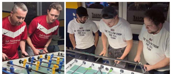
Auch das Team von „Siemens“ und das „Not the yellow from the egg“-Team vom Planungsbüro Bartsch hatten viel Spaß beim Turnier