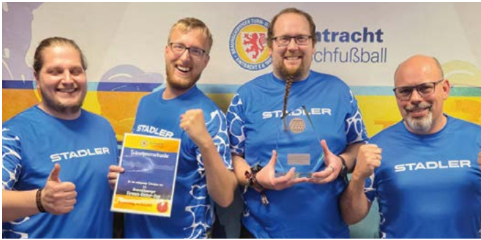
Freuen sich über die Siegetrophäe als Neuling: „Stadler Signalling“ ist Turniersieger im Profifeld

Der 4. November 2025 war wieder einmal ein ganz besonderer Tag für die Tischfußball-Abteilung von Eintracht Braunschweig, da sich an diesem Tag zum inzwischen elften Mal eine Vielzahl an Mannschaften von Firmen aus Braunschweig und Umgebung im Timeout getroffen haben, um den Titel des besten Kicker-Teams aus der Region auszuspüren. Und diesmal sollte es mit insgesamt sechs neuen Teams eine Menge Herausforderer für die altbekannten Teilnehmenden geben.