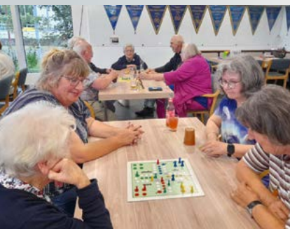
Einblick in die Abteilung – Die Sportgruppe Freizeit