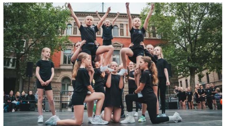
Das Youth-Team Unity zeigt eine Pyramide beim Trendsporterlebnis in der Braunschweiger Innenstadt