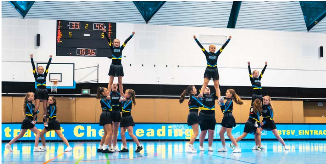
Halbzeit-Show mit voller Energie: Das Team Unity in ihren Cheerleading Uniformen auf dem Basketball Court

Bewegung, Teamgeist und Begeisterung beim Tag des Sports