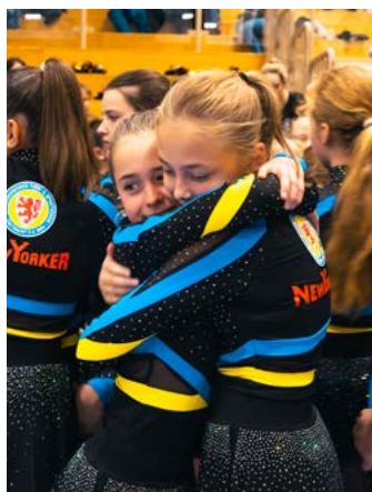
Zwei Athletinnen zeigen, was Cheerleading ausmacht: Teamgeist, Vertrauen und Leidenschaft