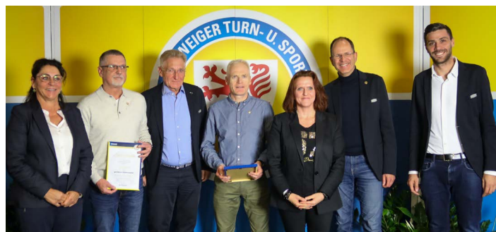
Die goldenen Ehrennadeln für 50 Jahre Mitgliedschaft. Verliehen am 17. November 2023