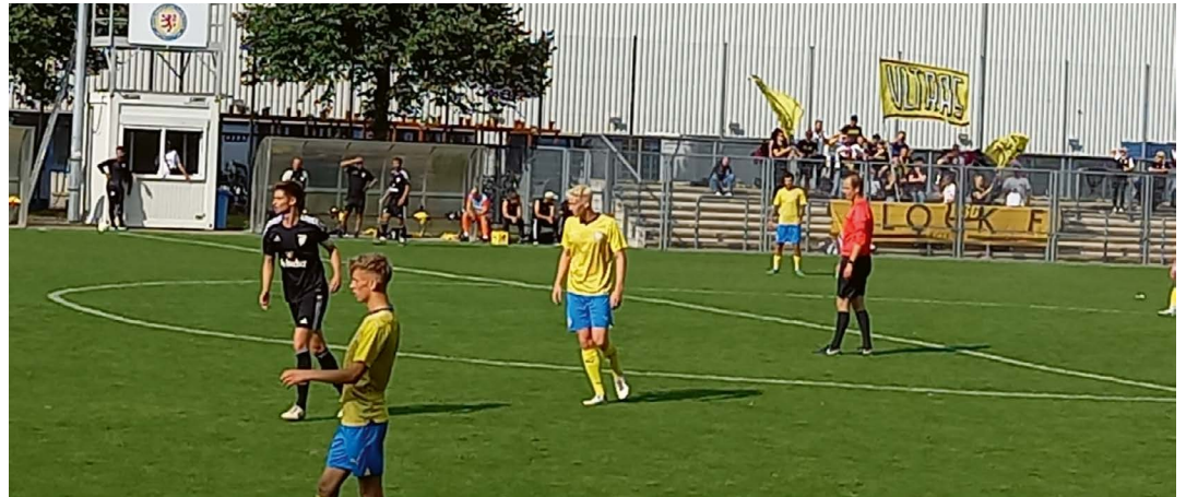
Am Samstag, 2. September 2023 hatte Eintrachts zweite Fußballmannschaft, die U23, mit einem 3:1 - Heimerfolg gegen den 1. SC Göttingen 05 nach fünf Spieltagen die Tabellenführung in der Landesliga Braunschweig übernommen.